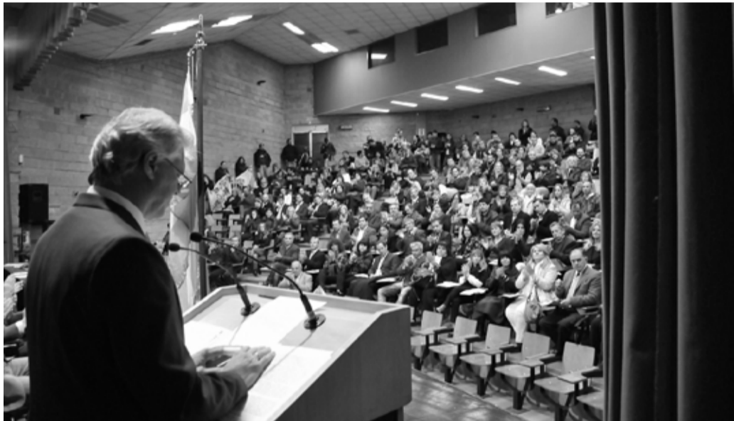
"La Universidad es fundamentalmente una potencia colectiva y plural de pensamiento y acción que se despliega sobre su territorio con su fuerza de imaginación y de creación", manifestó el rector.

la constitución de una Mesa de Articulación".