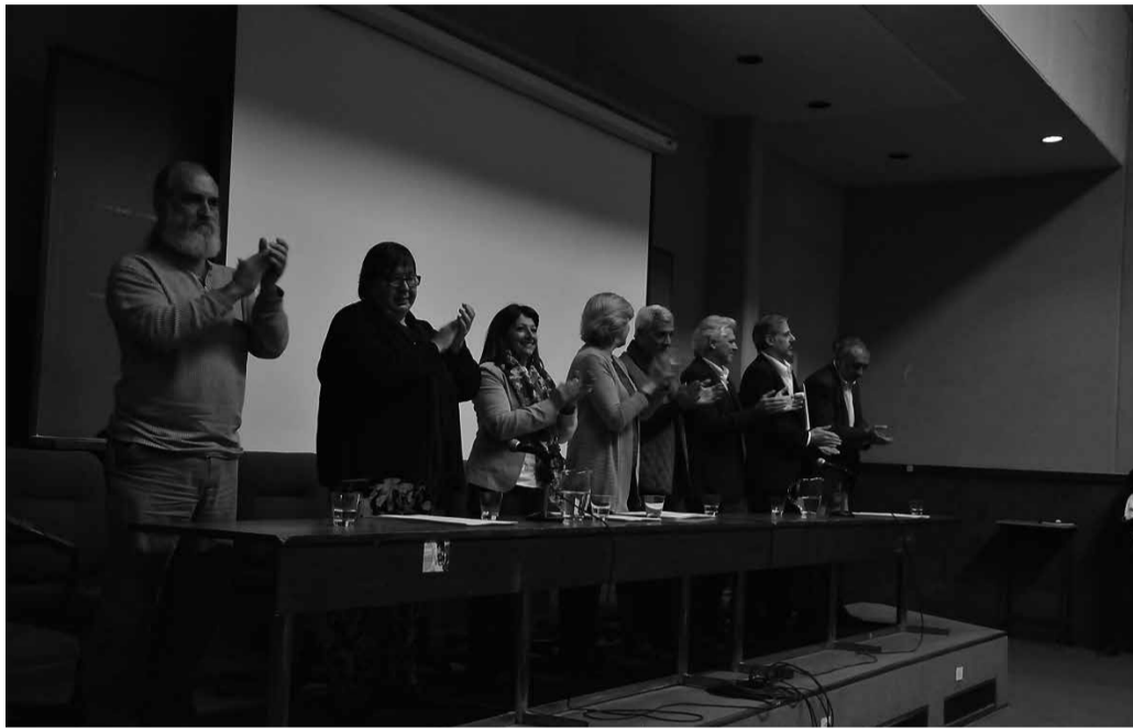
El acto tuvo lugar el lunes por la mañana en el Aula Magna de la Facultad de Agronomía y Veterinaria, presidido por las máximas autoridades de esta casa de estudios. Los consejeros de los claustros docente, nodocente y graduados tendrán dos años de mandato, mientras que los estudiantes uno