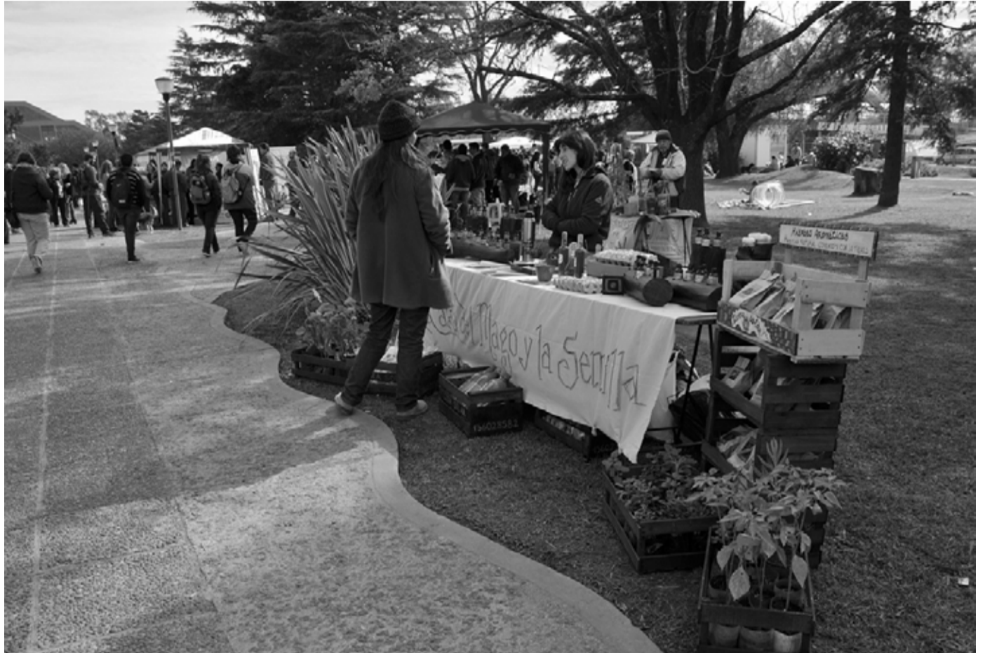
La actividad fue organizada por el Programa Pro Huerta AER INTA de Río Cuarto, la Municipalidad riocuartense, la Facultad de Agronomía y Veterinaria y la UNRC. Contó con la participación de más de 50 instituciones, productores familiares y artesanos.

El profesor Ohanian agradeció a las instituciones organizadoras por la dedicación, el apoyo y el