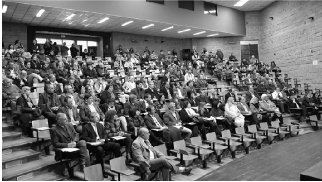
La sesión tuvo lugar en el marco de los festejos por el 45° aniversario de la creación de esta casa de estudios en el Aula mayor que se mostró colmada de público. Antes del ingreso de las autoridades se proyectó un video institucional sobre la historia de la Universidad elaborado por el canal UniRío TV.

"Promover la suscripción de un acta intención entre la UNRC y los tres municipios y sus respectivos Concejos Deliberantes que establezca las prioridades temáticas de interés común para conformar una agenda estratégica de trabajo del Gran Río Cuarto a cuyos efectos se consensua