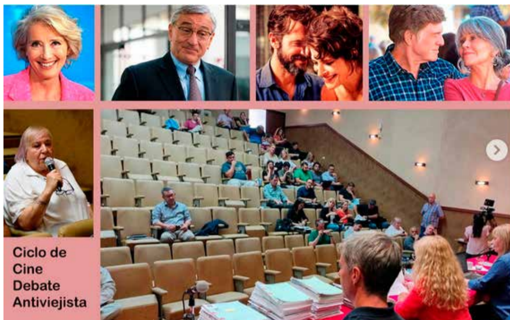
Ciclo de Cine Debate Antivejista

Lo organizan el Observatorio de Derechos Humanos de la UNRC y el Centro Recreativo Cultural para Personas Mayores El Illia. En la primera función, desde las 18 en el Teatrino de la Trapalanda (Colón 149), se verá "La vida empieza hoy"